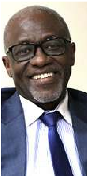
RENÉ YÉDIETI (CÔTE-D'IVOIRE)

René YÉDIETI est une figure majeure de la littérature et de l'industrie du livre en Côte d'Ivoire, reconnu pour son engagement profond dans la promotion de la culture et de l'éducation à travers la distribution et la diffusion du savoir.