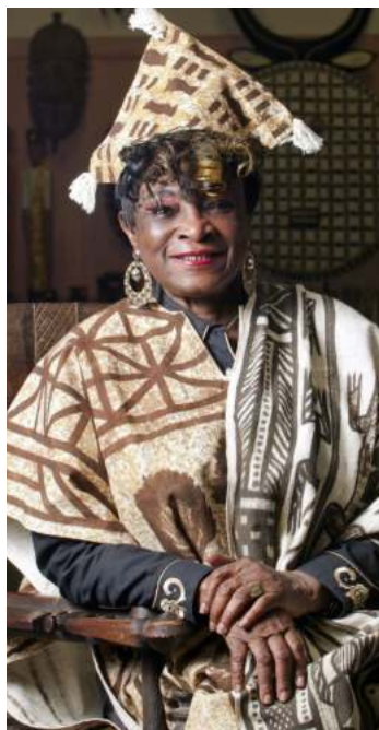
FATIM SYLLA (CÔTE-D'IVOIRE)

Fatim SYLLA est une pionnière de l'entrepreneuriat féminin en Côte d'Ivoire, reconnue comme la première femme entrepreneure et la première femme industrielle du pays et d'Afrique subsaharienne. Née dans une époque où les femmes étaient peu présentes dans le monde des affaires, elle a su braver les obstacles sociaux et culturels pour s'imposer comme une figure emblématique du développement économique et social ivoirien.