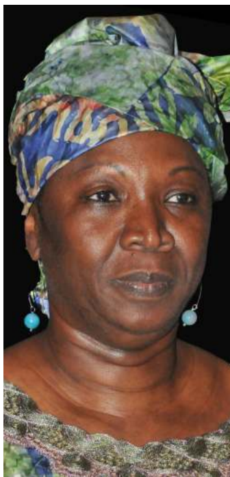
MARIAM SY DIAWARA (CÔTE-D'IVOIRE)

Née à Abidjan, en Côte d'Ivoire, elle est une figure incontournable de la communication, de l'édition et de la promotion culturelle africaine, dont l'influence s'étend bien au-delà des frontières ivoiriennes.